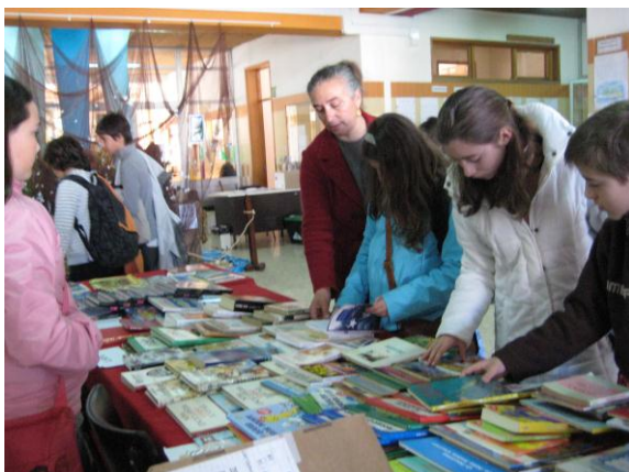
Feira do Livro Usado