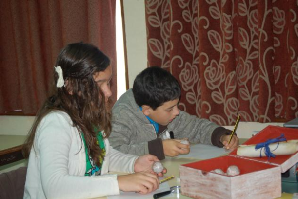
Caixa de Sonhos